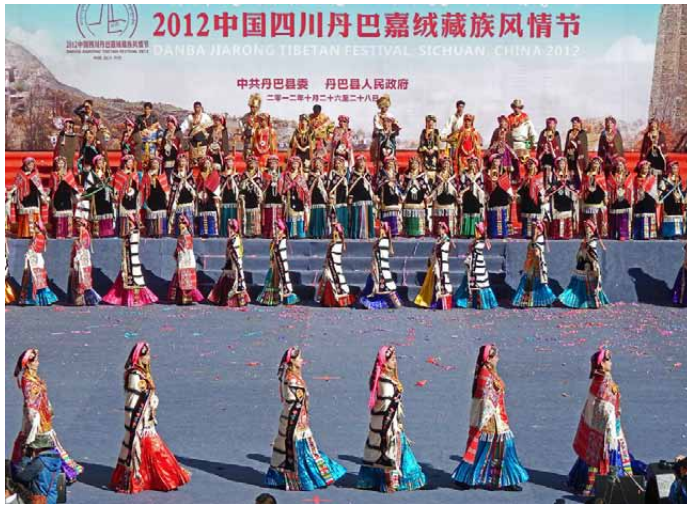
参加者全員の顔見世行進