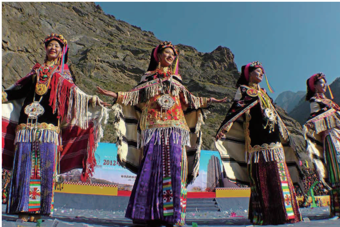
女王谷の美人コンテスト・二次審査の顔見せ

今年の女王谷（現在ギャロンと呼ばれる地域のチベット語の原名“rGyalmorong”の意識）は異常気象で、例年9月初旬の雨季明けが10月中旬へずれ込みました。そのため丹巴で毎年10月末に開かれる風情節のお祭りが連日好天に恵られました。この風情節のお祭りで最も脚光を浴びるのが「丹巴美人のコンテスト」です。古来から色々な部族が入り込んでいる丹巴は美人が多いことで有名で、その丹巴の美人コンテストと言う事で多くの観客が集まります。