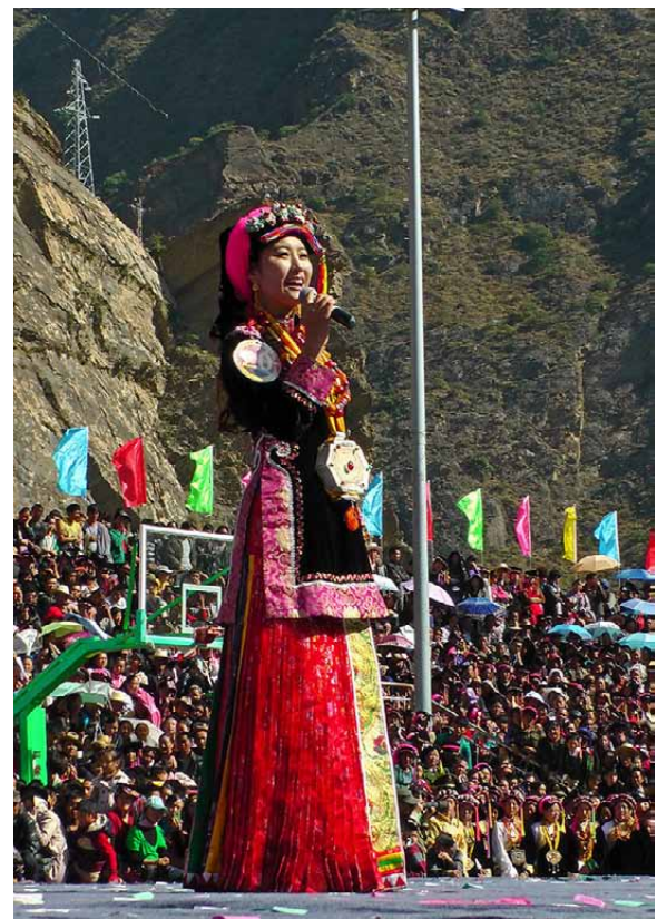
二次審査での特技披露(3)