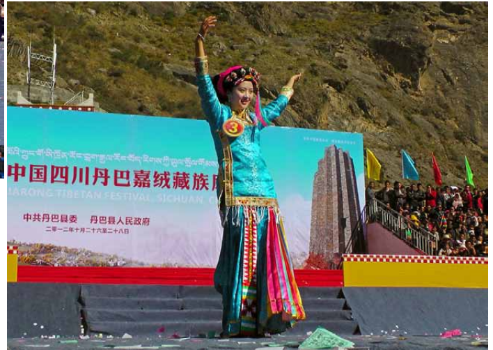
二次審査での特技披露(1)

丹巴の美人コンテストの賞品は「金花1万元=1名、銀花8000元=2名、石榴花6000元=3名」だそうです。また丹巴の美人は芸達者が多く、美人コンテストでの評価に関係なく成都や他の都市で芸能活動をして高収入を得ている人が多いそうです。