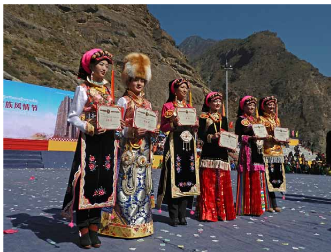
表彰者の合同写真

丹巴の美人コンテストの賞品は「金花1万元=1名、銀花8000元=2名、石榴花6000元=3名」だそうです。また丹巴の美人は芸達者が多く、美人コンテストでの評価に関係なく成都や他の都市で芸能活動をして高収入を得ている人が多いそうです。