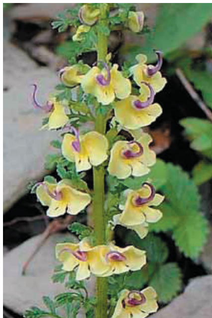
ゴマノハグサ科-シオガマギク

食を撮り、二日に亘り昼食弁当用に別途注文した。もう1つは、宿併設のレストランで出た煮込んだ肉(?)の一皿で、今までの少し硬めの肉(ヤクや豚)に比べて何と柔らかく美味なることか。何の肉かと店員に問えば、「なす」のと返事。一同、驚きの声と同時にこの肉料理(!?)を一気に胃の腑に収めた。