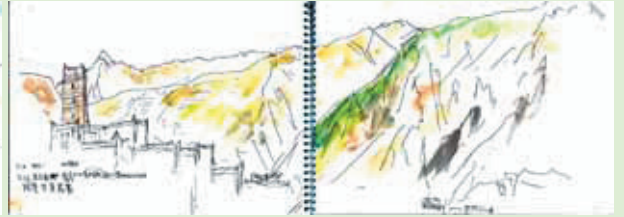
gān bǎo zàng zhài 甘堡藏寨