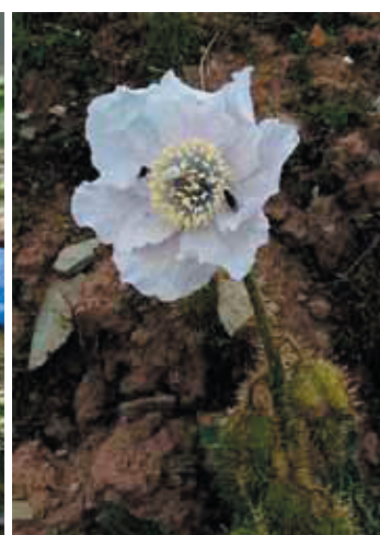
白いケシ (青いケシのアルビノ種)

★紙面の関係で掲載できない写真とスケッチを‘わりい’ HPフォトギャラリーに掲載しました。是非ご訪問をお待ちしています。