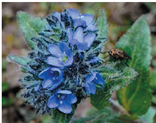
ゴマノハグサ科-イヌノフグリ仲間