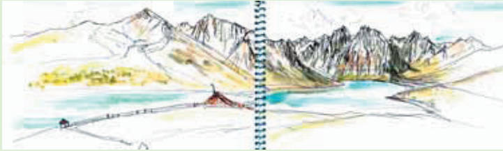
xī mén cuò 希門措*

四姑娘山自然保護区管理局特別顧問の大川さんにご案内いただき、恒例のチベット高原花の旅は、「未訪の地を訪ねたい」という関根の要望で青海省のアムネマチン山(6,282m)の山麓まで車を走らせ花を楽しんだ。