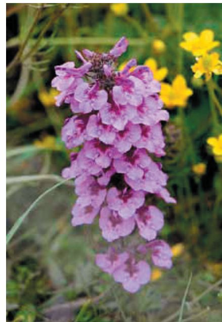
ゴマノハグサ科-シオガマギク